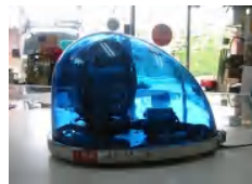
車の屋根に取り付け使用