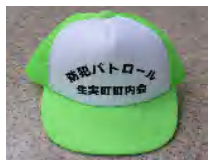
腕章及びキャップ