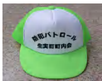
腕章及びキャップ