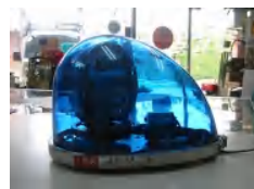
車の屋根に取り付け使用