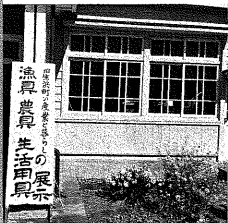
【千年の釘を見ている生浜西小の児童】

☆千年の釘が製作された過程には、必ず尽力した人々が存在します。どのような人々が携わり、どんな研究をして、どんな製法で行ってきたのか等について若干の資料を添えて現代版「千年釘」を展示しています。どうぞ旧生浜町役場庁舎に足を運び、「千年釘」に会いに来てみませんか。そして、直接触れて手触りや重みを感じてみてはいかがでしょうか。お待ちしております。